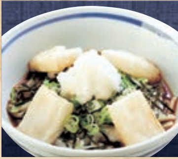
揚げもちおろし 890円