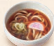
ミニ温かいうどん