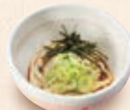
ミニ冷たいうどん