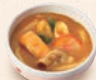
ミニカレーうどん