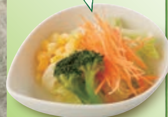
プチベジサラダ 200円(税込220円)

最初に野菜を食べることで 血糖値の急な上昇を防ぎ 脂質の吸収を抑えてくれる 効果があります。