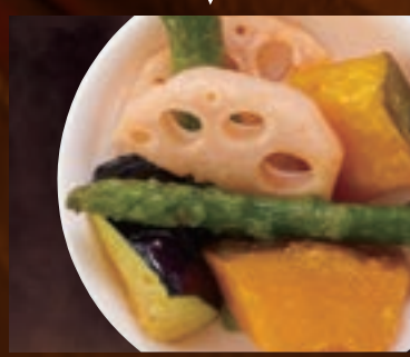
ゴロゴロ野菜 364円(税込400円)