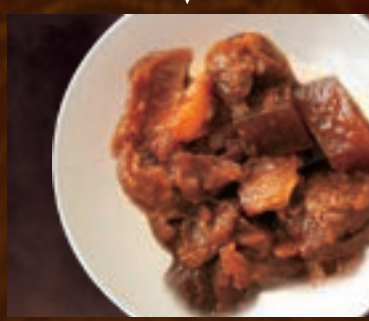
牛すじで味噌煮 255円(税込280円)