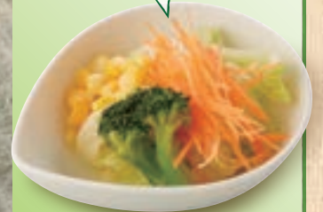
プチベジサラダ 200円(税込220円)

最初に野菜を食べることで 血糖値の急な上昇を防ぎ 脂質の吸収を抑えてくれる 効果があります。