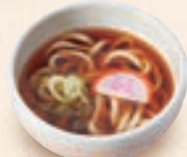
ミニ温かいうどん ミニ温かいそば