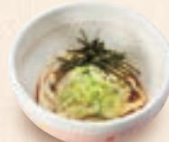
ミニ冷たいうどん ミニ冷たいそば