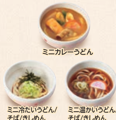
ミニカレーうどん ミニ冷たいうどん/ そば/きしめん ミニ温かいうどん/ そば/きしめん