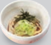
ミニ冷たいうどん/きしめん