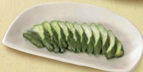
きゅうりの一本漬 410円(税込450円)