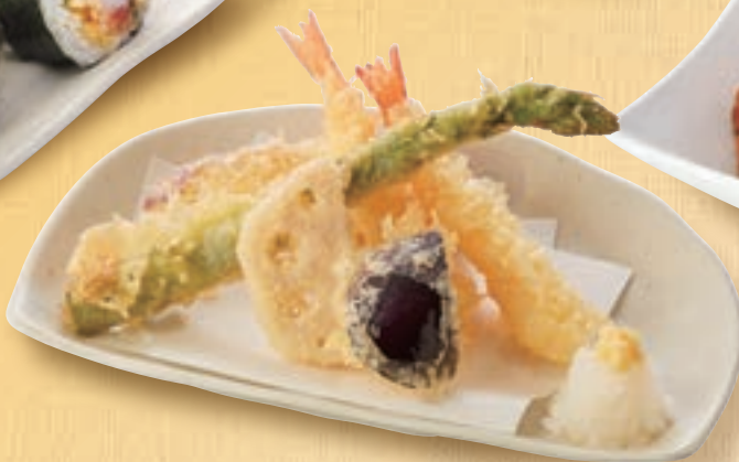
天ぷら盛り合わせ 682円(税込750円)