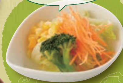
プチベジサラダ 200円(税込220円)

最初に野菜を食べることで 血糖値の急な上昇を防ぎ 脂質の吸収を抑えてくれる 効果があります。