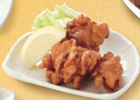
鶏唐揚げ 400円(税込440円)