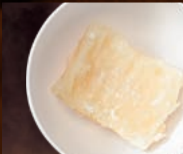
揚げもち 191円(税込210円)