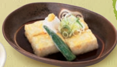
揚げ出し豆腐 500円(税込550円)