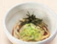
ミニ冷たいうどん