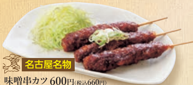
名古屋名物 味噌串カツ 600円(税込660円) ※おろし又はソースに変更できます。