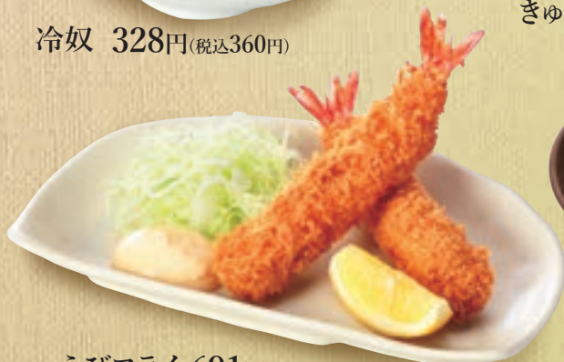
えびフライ 691円(税込760円)