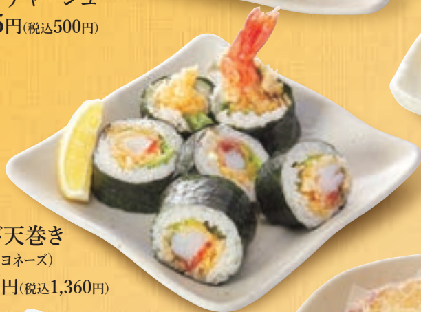
大えび天巻き (ゆかり/マヨネーズ) 1,237円(税込1,360円)