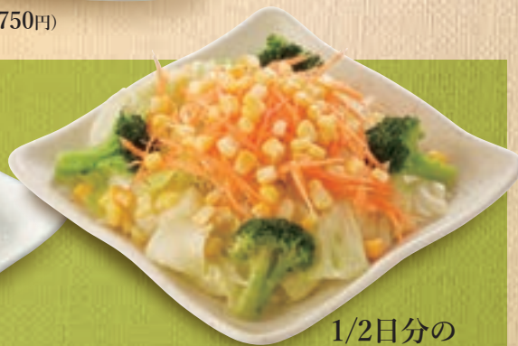
1/2日分の 野菜サラダ 655円(税込720円)