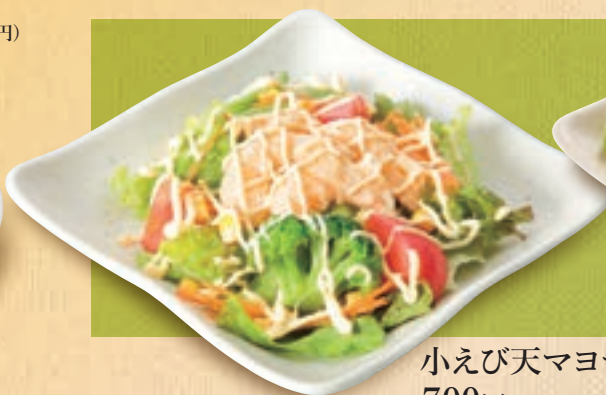
小えび天マヨサラダ 700円(税込770円)