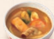
ミニカレーうどん