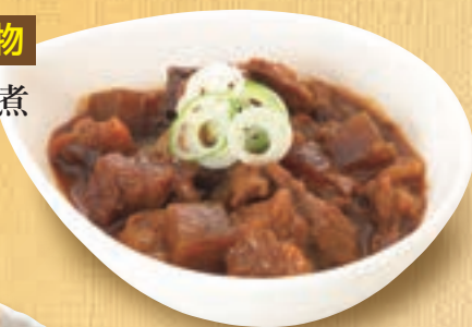
牛すじどて味噌煮 746円(税込820円)