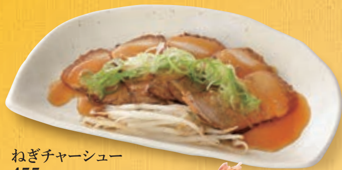
ねぎチャーシュー 455円(税込500円)