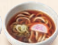
ミニ温かいうどん