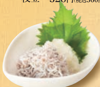
しらすおろし 346円(税込380円)