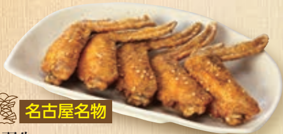
名古屋名物 手羽先(甘辛だれ又はカレースライス味) 3本 428円(税込470円) 得 5本 682円(税込750円)