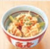
ミニえび Mayo 井