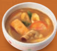
ミニカレーうどん