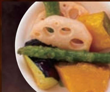
ゴロゴロ野菜 364円(税込400円)