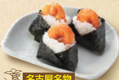
名古屋名物 天むす (3個)455円(税込500円) (6個)910円(税込1,000円)