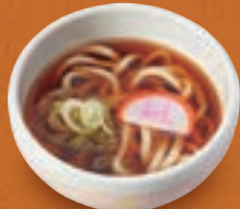
ミニ温かいうどん ミニ温かいぎしめん