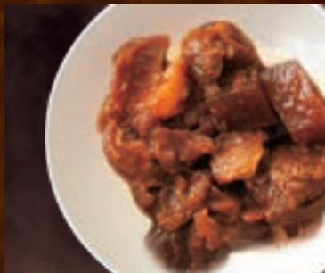
牛すじで味噌煮 255円(税込280円)