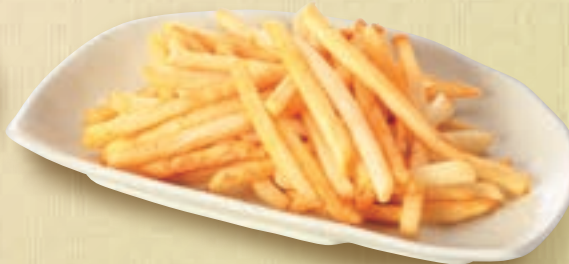
ポテトフライ (塩又はカレースライス味) 482円(税込530円)