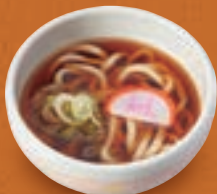
ミニ温かいうどん/ そば/きしめん