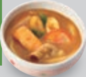
ミニカレーうどん