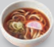
ミニ温かいうどん/ そば/きしめん