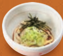
ミニ冷たいうどん/ そば/きしめん