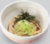
ミニ冷たいうどん/ そば/きしめん