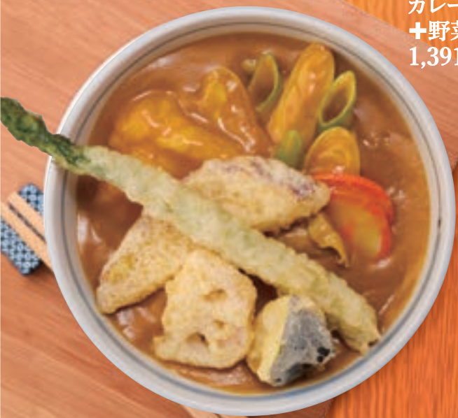
カレーうどん +野菜天ぷら 1,391円(税込1,530円)