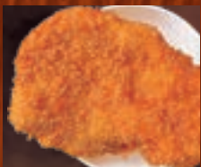
ロースカツ 500円(税込550円)