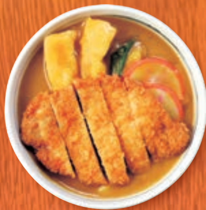
カレーうどん +ロースカツ 1,500円 (税込1,650円)