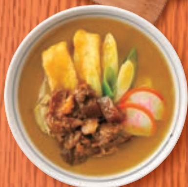
カレーうどん +牛すじで味噌煮 1,364円(税込1,500円)