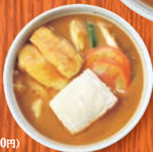
カレーうどん +揚げもち 1,228円(税込1,350円)