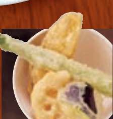
野菜天ぷら 391円(税込430円)