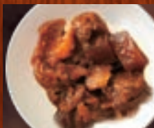
牛すじで味噌煮 364円(税込400円)