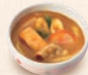
ミニカレーうどん ミニカレーきしめん