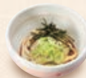
ミニ冷たいうどん ミニ冷たいきしめん