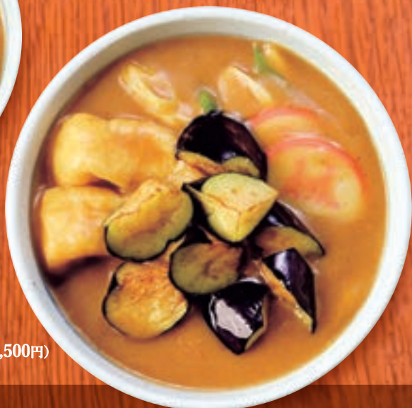
カレーうどん +揚げなす 1,364円(税込1,500円)