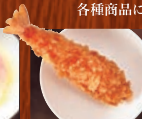
えびフライ(1本) 410円(税込450円)