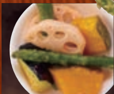
ゴロゴロ野菜 410円(税込450円)