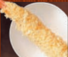
大えび天ぷら(1本) 637円(税込700円)