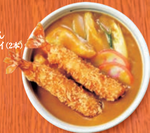
カレーうどん +えびフライ(2本) 1,819円 (税込2,000円)