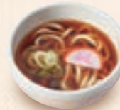
ミニ温かいうどん ミニ温かいきしめん