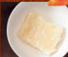
揚げもち 228円(税込250円)