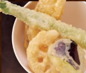
野菜天ぷら 391円(税込430円)