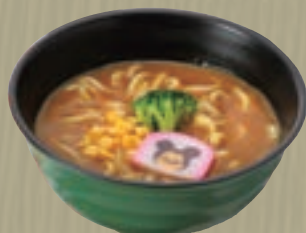
ちびっこカレーうどん 769円 (税込 830円)