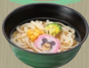
ちびっこうどん 649円 (税込 700円)