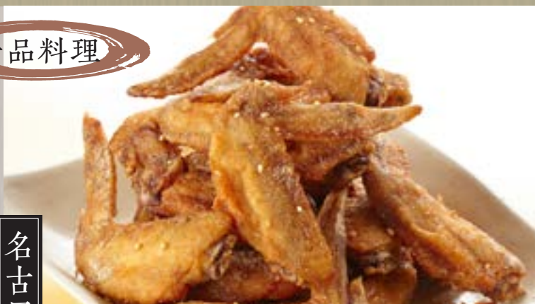
手羽先 (5本) 750円 (税込 810円)