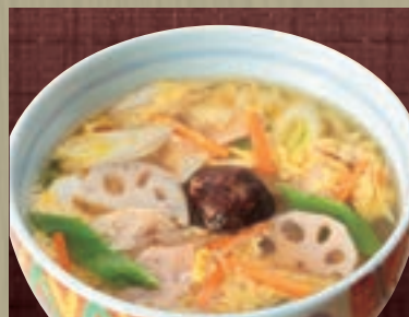
五目 871円 (税込 940円)