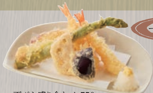
天ぷら盛り合わせ 750円 (税込 810円)