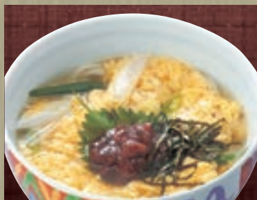
梅とじ 871円 (税込 940円)