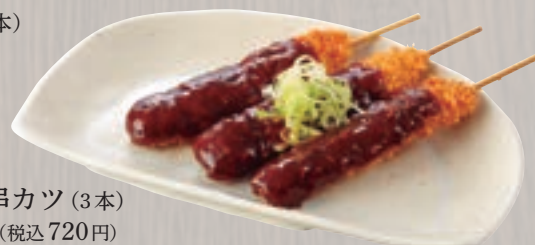
味噌串カツ (3本) 667円 (税込 720円)