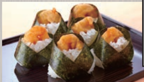
天むす (6個) 982円 (税込 1,060円)