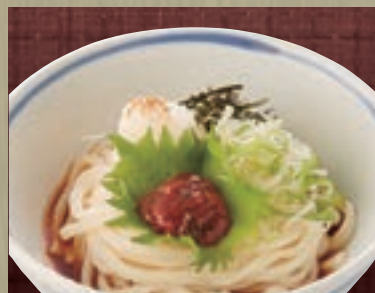
梅じそおろし 871円 (税込 940円)