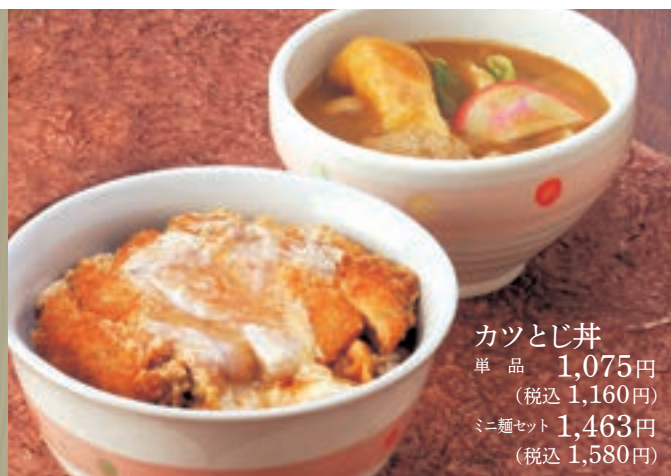
カツとじ丼 単品 1,075円 (税込 1,160円) ミニ麺セット 1,463円 (税込 1,580円)