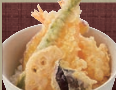
天丼 単品 1,075円 (税込 1,160円) ミニ麺セット 1,463円 (税込 1,580円)