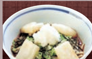
揚げもちおろし 926円(税込1,000円)