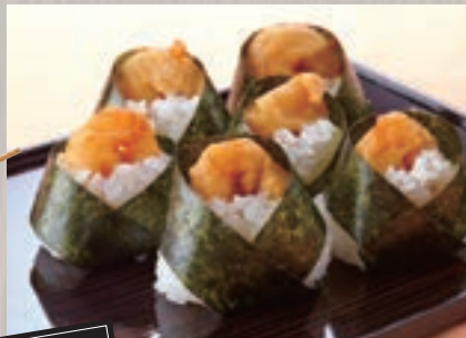
天むす(6個) 973円(税込1,050円)