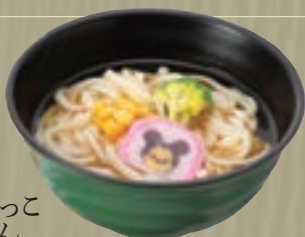
ちびっこ うどん 741円(税込800円) ジュース付