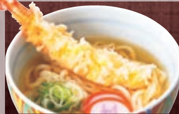
大えび天ぷら 1,389円(税込1,500円)

かけ 787円(税込850円) 玉子とじ 806円(税込870円) 梅とじ 880円(税込950円) 五目 880円(税込950円)