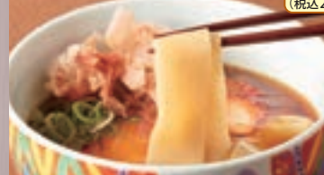
鯨風きしめん(温) 852円(税込920円)