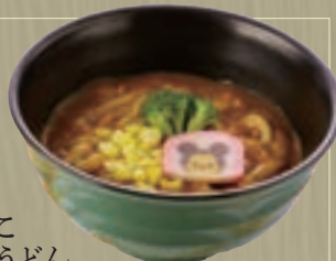
ちびっこ カレーうどん 880円(税込950円) ジュース付