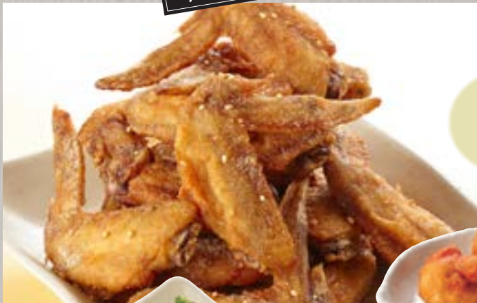
手羽先 (5本) 741円 (税込800円)