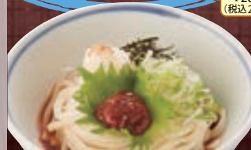
梅じそおろし 871円(税込940円)