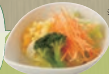
プチベジサラダ 241円(税込260円)

まずは 野菜を食おう！ 血糖値の急な上昇を防ぎ 脂質の吸収を抑えてくれる 効果があります。