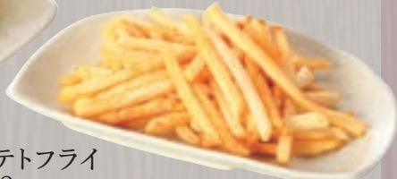
ポテトフライ 528円(税込570円)