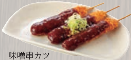
味噌串カツ (3本)695円 (税込750円)