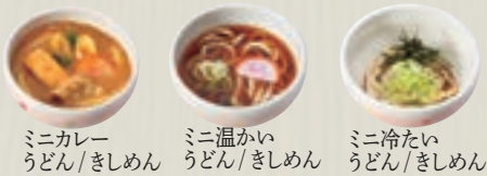
ミニカレーうどん/きしめん ミニ温かいうどん/きしめん ミニ冷たいうどん/きしめん

まずは 野菜を食おう！ 血糖値の急な上昇を防ぎ 脂質の吸収を抑えてくれる 効果があります。