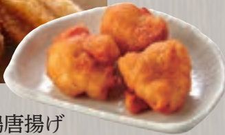
鶏唐揚げ 463円(税込500円)