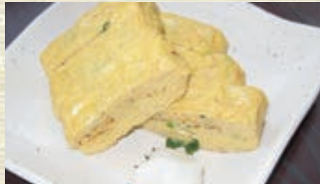
手作りだし巻玉子 628円 (税込 690円)