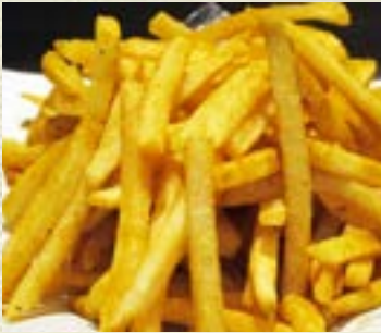
山盛りポテトフライ(カレー味or塩) 673円(税込740円) レギュラーサイズ 482円(税込530円)