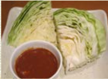
辛味噌キャベツ 400円 (税込 440円)