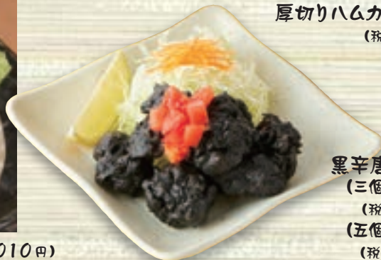
黒辛唐揚げ (三個) 419円 (税込460円) (五個) 664円 (税込730円)