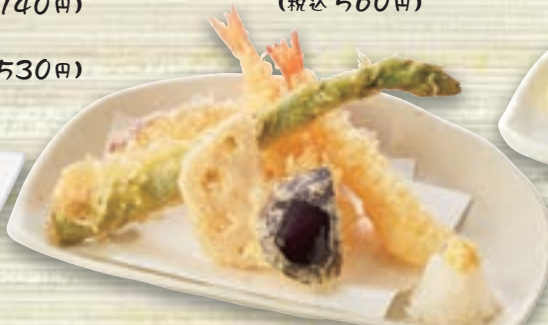
天ぷら盛り合わせ 682円 (税込750円)