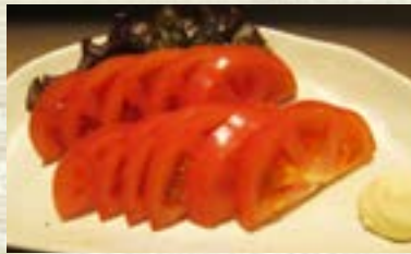
冷やしトマト 473円 (税込 520円)