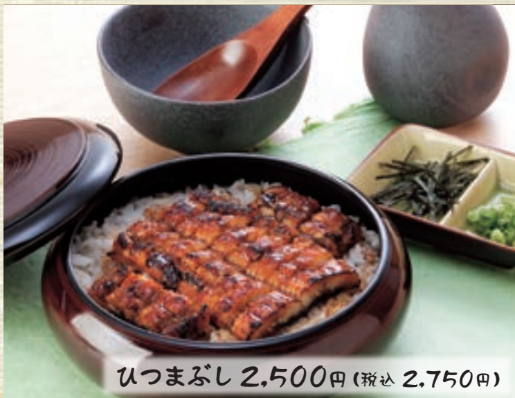
ひつまぶし 2,500円(税込 2,750円)

三種類の味が楽しめる「ひつまぶし」。 葱・海苔・わさびの薬味と だしをかけてどうぞ。