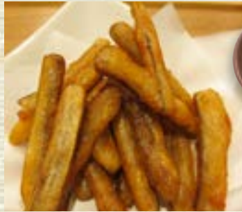
ごぼうの唐揚げ 510円 (税込560円)