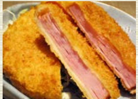
厚切りハムカツ 400円 (税込440円)