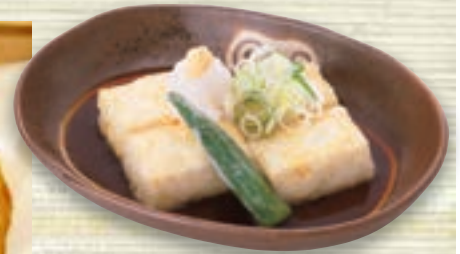
揚げ出し豆腐 500円 (税込550円)