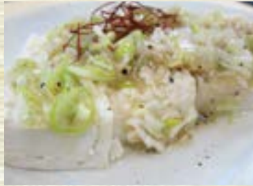
塩ダレネギ飯 428円 (税込 470円)