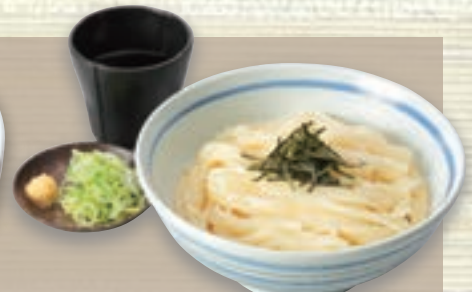
ざるきしめん 728円 (税込 800円)