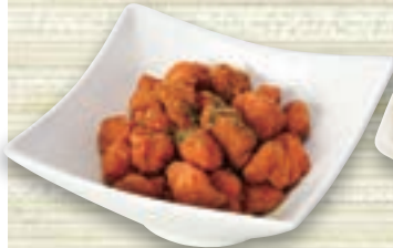
カレースライス 軟骨唐揚げ 482円(税込530円)