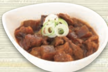
牛すじどて味噌煮 746円(税込 820円)

食感を楽しめる牛すじ肉を 八丁味噌でゴトゴト煮込んだ一品。 一緒に煮込んだ蒲蒟にも しかり味がしみ込んでいます。