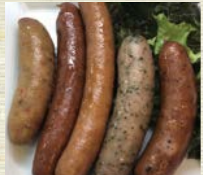
ソーセージ盛合せ 955円 (税込 1,050円)