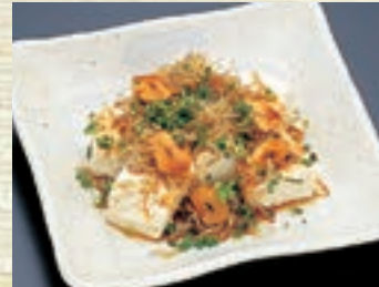
じゃこにんにく飯 591円 (税込 650円)

カリカリに揚げたスライスにんげんと しらすを冷奴の上にまぶして、 ピリ辛ダレをかけた一品。