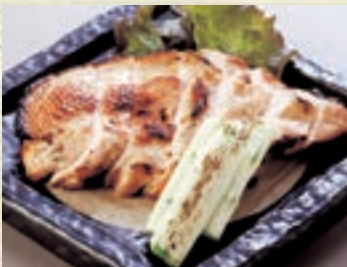
名古屋コーチン胸肉網焼 955円(税込 1,050円)