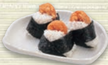
天むすび (三個) 455円(税込 500円)