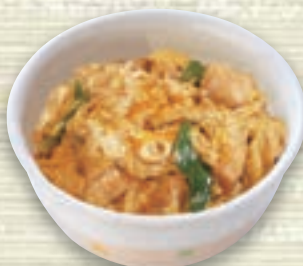
名古屋コーチンの親子丼 単品(味噌汁付) 1,128円(税込 1,240円) ミニ麺付 1,520円(税込 1,680円)