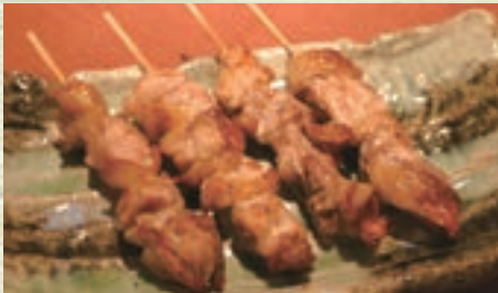
名古屋コーチン串焼き (1本) 400円 (税込 440円)