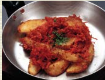
じゃがいもコンビーフ 673円 (税込 740円)