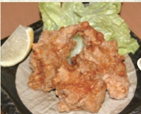
名古屋コーチン唐揚げ 919円(税込1,010円)