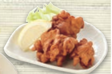
鶏の唐揚げ (三個) 400円 (税込440円) (五個) 646円 (税込710円)