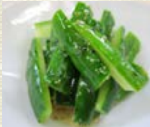
塩ダレ胡瓜 410円 (税込 450円)