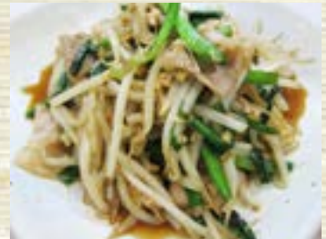
ニラもやし炒め 573円 (税込 630円)