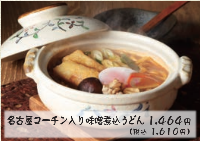
名古屋コーチン入り味噌煮込うどん 1,464円 (税込 1,610円)

塩なしの真水で打ったうどんを 八丁味噌をベースに数種類の 味噌をだし汁の中に入れ、 土鍋で煮込んだ 代表的な名古屋の郷土料理。 塩なしゆえの堅めの麺の食感と、 八丁味噌の風味が独特。