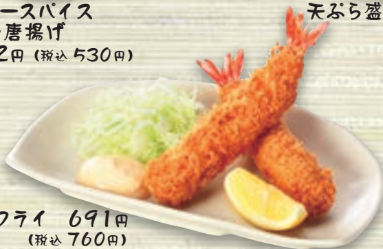
えびフライ 691円 (税込760円)