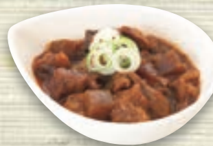
牛すじどて味噌煮 746円 (税込 820円)