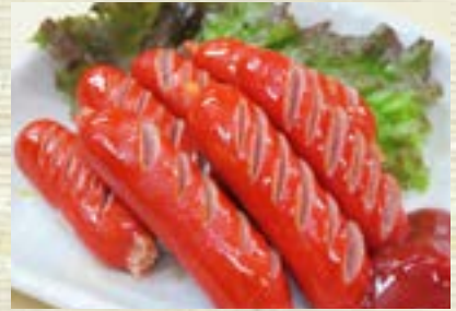
赤ワインナー炒め 482円 (税込 530円)