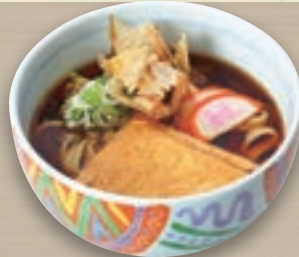
鯨風きしめん 800円 (税込 880円)