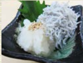
しらすおろし 346円 (税込 380円)