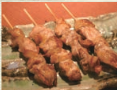
名古屋コーチン胸肉網焼 955円(税込 1,050円)