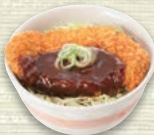
味噌カツ丼 単品(味噌汁付) 1,000円(税込 1,100円) ミニ麺付 1,400円(税込 1,540円)