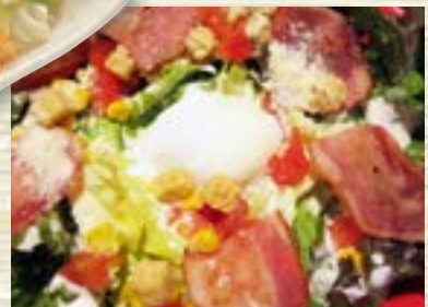
シーザーサラダ 800円 (税込 880円)