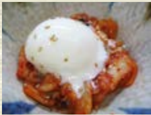
温玉キムチ 400円 (税込 440円)